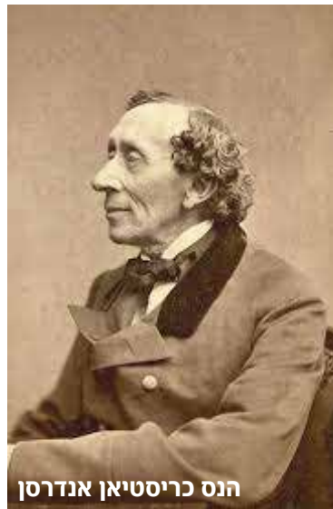
הנס כריסטיאן אנדרסן

ארבע בנותיי נולדו בקופנהגן הרחוקה. בילדותן קראתי להן הרבה סיפורים ואגדות, מספר האגדות של הנס כריסטיאן אנדרסן. לאט לאט הפכו אגדות אלה לסיפורים האהובים עליהן ביותר, ובבתיהן יש עד היום את אוסף האגדות של אנדרסן, גם בדנית וגם תרגומים בעברית, למען הדור הבא שנולד כבר כאן בישראל. אנדרסן הוא אשף הדמיון והשימוש בשפה הדנית. בסיפוריו מופיעים גם סיפורים ואגדות ששמע בילדותו ולאט לאט התחיל להוסיף ולכתוב מדמיונו ובשפתו העשירה והמיוחדת. הוא כתב לילדים, אך גם מבוגרים נהנים מסיפוריו שבהם הם מוצאים הרבה מוסר השכל, וביקורת סמויה וגלויה על החברה הדנית, על כל רבדיה. סיפורי אגדותיו הם תענוג צרוף, חוויית קריאה מהנה ונהדרת. דמיונו הפורה וחוש ההומור שלו גורמים לסיפוריו להיות חוויה מחנכת ומלמדת.