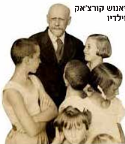
יאנוש קורצ'אק וילדיו

אפופים היינו בגיבורי הסופרים שהדהימו את נפשותינו, והרחיבו לב ודעת.